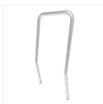
Garde-corps en option