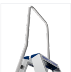
2 versions disponibles : avec ou sans garde-corps