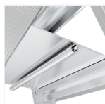
Système de charnière anti-pincement

Gamme EN 131 sauf 2 marches normé EN 14183.