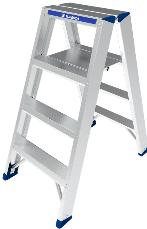
Modèle présenté : 02374844